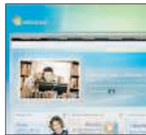
Il portale Windows-Msn arriverà sui cellulari Tim

Quando le galassie del web e della telefonia mobile si incontrano il risultato è un Big Bang tecnologico nell'Internet Mobile. E' accaduto con la firma dell'accordo tra Microsoft Online e Telecom Italia che porterà ai cellulari italiani il mondo di Msn e di Windows Live. La partnership permetterà infatti ai clienti Tim di accedere direttamente dal cellulare al portale Msn Mobile, alla propria casella di posta Windows Live Hotmail e ai servizi più richiesti della famiglia Windows Live. In termini pratici gli utenti potranno controllare dal loro Portale Mobile l'account di posta elettronica, chiacchierare con gli amici attraverso Messenger, aggiornare il proprio blog su Spaces, accedere ai contenuti digitali o fare ricerche sul web con Live Search.